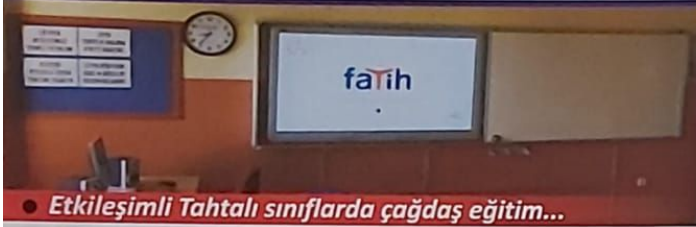
• Etkileşimli Tahtalı sınıflarda çağdaş eğitim...

1976'da Bafra Ticaret Lisesi olarak kurulan okulumuz 2014-2015 Eğitim öğretim yılından itibaren Otelcilik ve Turizm Meslek lisesi ile birleşerek Şehit Erkut Yılmaz Mesleki ve Teknik Anadolu Lisesi ismini almıştır. Derslik sayısı 32 olan okulumuzda, 6 bölüm (alan), yaklaşık 800 öğrenci, 70 öğretmen ve personel bulunmaktadır. Uygulamalı mesleki dersleri için 14 adet atölye ve laboratuvar, 200 kişilik konferans salonu, birer adet fen laboratuvarı, kütüphane, yemekhane, kantin, açık spor sahası ve çeşitli sosyal alanlar ile eğitim öğretim hizmeti vermektedir.