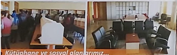
Kütüphane ve sosyal alanlarımız...