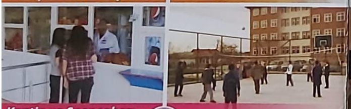
Kantin ve Spor sahası

FRA ŞEHİT ERKUT YILMAZ MESLEKİ VE TEKNİK ANADOLU LİSESİ