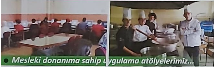
• Mesleki donanımına sahip uygulama atölyelerimiz...