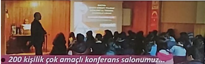
• 200 kişilik çok amaçlı konferans salonumuz...